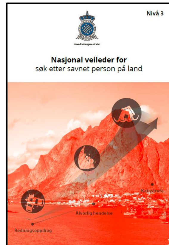
Nivå 3 «taktisk nivå»