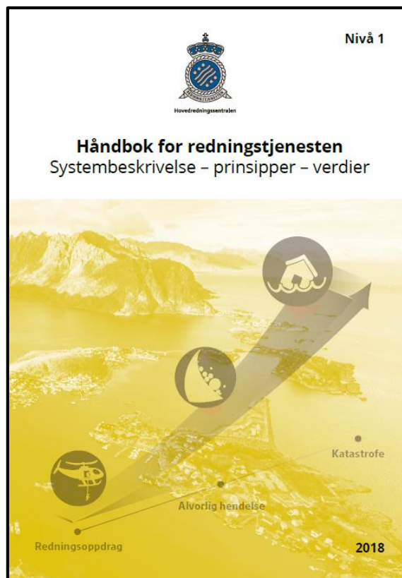
Nivå 1 «strategisk nivå/systembeskrivende»